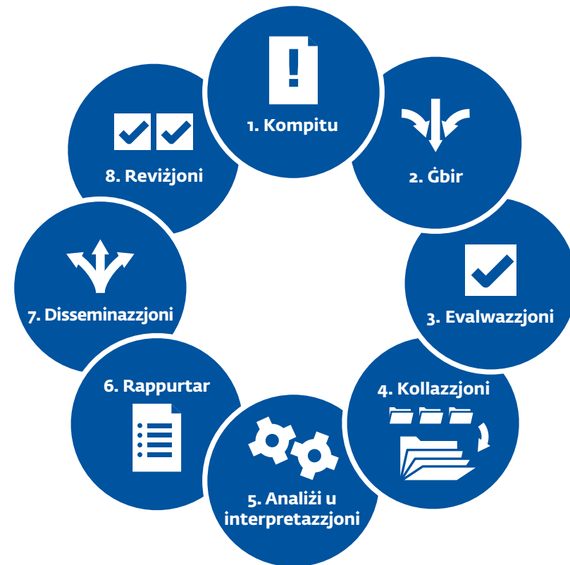
Grafika 4: Ċiklu ta' intelligence

Il-premessa bażika taċ-ċiklu tal-Intelligence hija li l-isfruttament sistematiku tal-informazzjoni jwassal għal prodotti effettivi li jippermettu lil dawk li jieħdu d-deċiżjonijiet jindirizzaw ir-riskju.