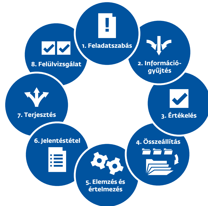
4. ábra: A hírszerzési ciklus

A hírszerzési ciklus alapelve az, hogy az információk szisztematikus felhasználása olyan hatékony termékek létrejöttéhez vezet, amelyek lehetővé teszik a döntéshozók számára a kockázatok kezelését.